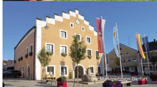
Der Marktplatz von Dietfurt