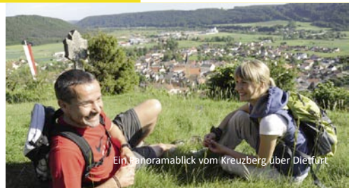
Ein Panoramablick vom Kreuzberg über Dietfurt