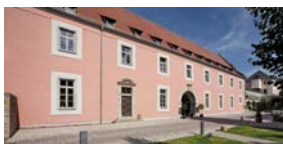
Die Zehntscheune am Juliusspital Weinstuben.

Tagungszentrum in der Zehntscheune Klinikstraße 1 97070 Würzburg